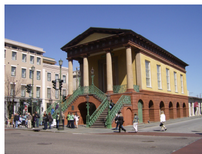
Ett av de äldsta busen i centrala Charleston

Dokumentationen från konferensen beräknas vara godkänd och distribuerad vår/sommar 2009.